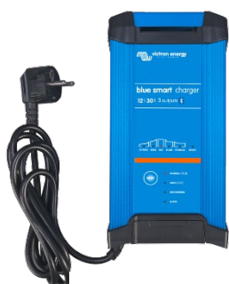
Blue Smart IP22 12/30 (3)