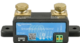
Датчик Bluetooth: SmartShunt