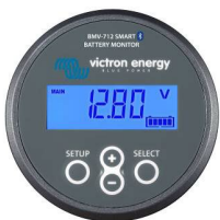
Bluetooth-датчик: BMV-712 Smart Battery Monitor