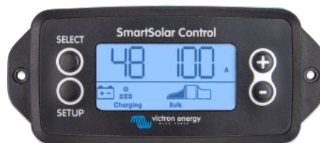
Подключаемый экран SmartSolar

Просто снимите резиновую заглушку, которая закрывает разъем спереди контроллера и вставьте кабель монитора.