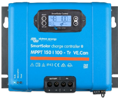
Контроллер заряда SmartSolar MPPT 150/100-Tr VE.Can с опциональным подключаемым экраном