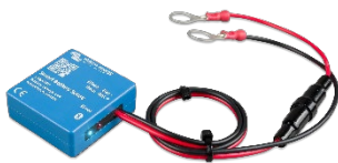
Bluetooth-датчик: Smart Battery Sense